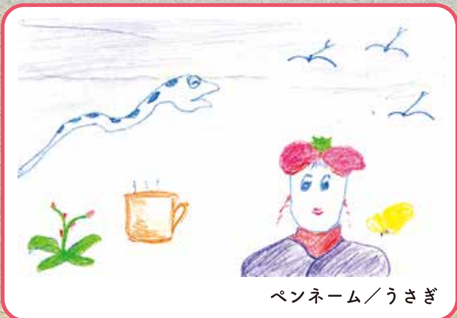
ペンネーム/うさぎ

日中はかなり暖かさを感じられるようになりましたね。春の訪れが感じられます。このまま雪どけが進まないかな～。