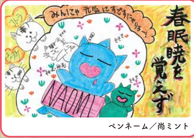
ペンネーム/尚ミント

皆さんから 牛乳や酪農を題材にした川柳を募集しています。 ウシさんも 待っていますよ 春よ来い！ (コンサ大好き親父) 散歩する ホット一息 ミルクのむ みわたせば こどりのすがた みえかくれ (うさぎ)