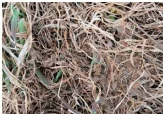
写真1) 枯れ草の下で萌芽している様子