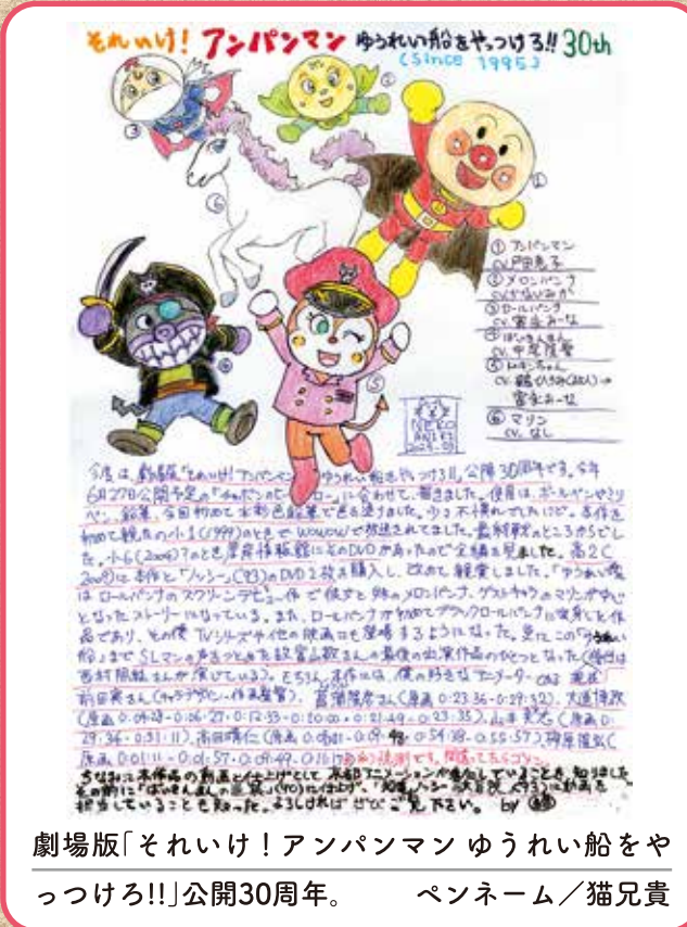
劇場版「それいけ! アンパンマン ゆうれい船をやっつけろ!!」公開30周年。 ペンネーム/猫兄貴